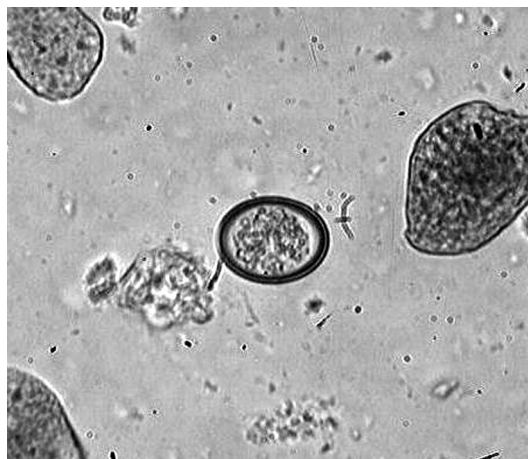
Рис. 2. E. suis , неспорулированная ооциста.