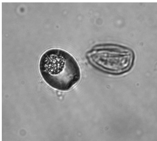
Рис. 5. E. scabra , неспорулированная ооциста.

Ооцисты (рис. 5) характеризуются овальной, яйцевидной или овально-удлиненной (эллипсоидной) формой, преимущественно светло-коричневого или жёлто-зелёного цвета. Внешняя оболочка шероховатая, двухконтурная. На одном из полюсов она истончается, образуя хорошо выраженное микропиле, что является важным диагностическим признаком. Его диаметр 3,5–4,5 мкм. Зародышевая масса мел-