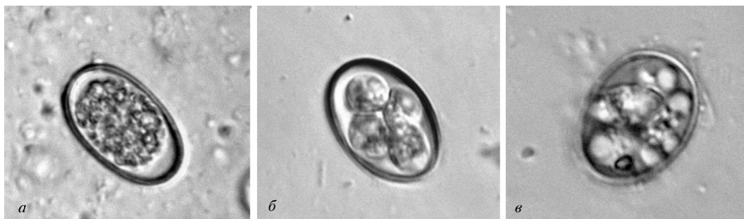
Рис. 1. Ооциста E. deblickei : а — неспорулированная; б — на стадии формирования спорозоитов; в — спорулированная.

Ооцисты (рис. 1) характеризуются достаточно широкими морфологическими вариациями по форме и цвету. Нами зарегистрировано овальную, овально-удлиненную, широкоовальную, яйцевидную и эллипсоидную форму. Цвет преимущественно жёлтый, иногда с коричневым или розовым оттенками. Спорулированные ооцисты, как правило, имели зеленоватый цвет, иногда с розовыми тонами. Внешняя оболочка гладкая, бесцветная, сформированная с двух слоёв. Микропиле и полярная шапочка отсутствуют. Размер ооцист составил 28,4 \pm 1,16 \times 19,7 \pm 1,34 мкм, минимальный — 21,6 \times 16,2 мкм, максимальный — 35,1 \times 27 мкм, индекс формы — 1,47 \pm 0,07 . Это свидетельствует о том, что типичной для данного вида простейших есть широкоовальная форма.