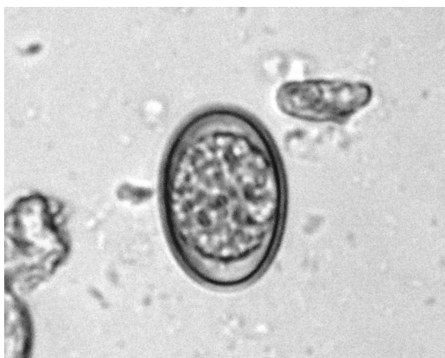
Рис. 6. Неспорулированная ооциста E. neodebliecki .

По нашим данным, время споруляции составило 320 \pm 1,91 ч, минимум — 310, максимум — 328. Препатентный период — 10 сут, патентный — 6 сут (Крылов, 1996). Паразит относится к слабопатогенным видам (Ятусевич, 1989). Место локализации возбудителя — голодная и подвздошная кишки.