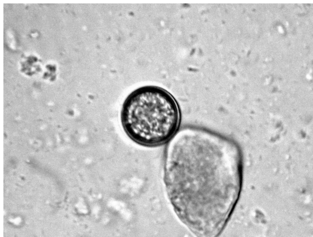
Рис. 3. E. perminuta , неспорулированная ооциста.