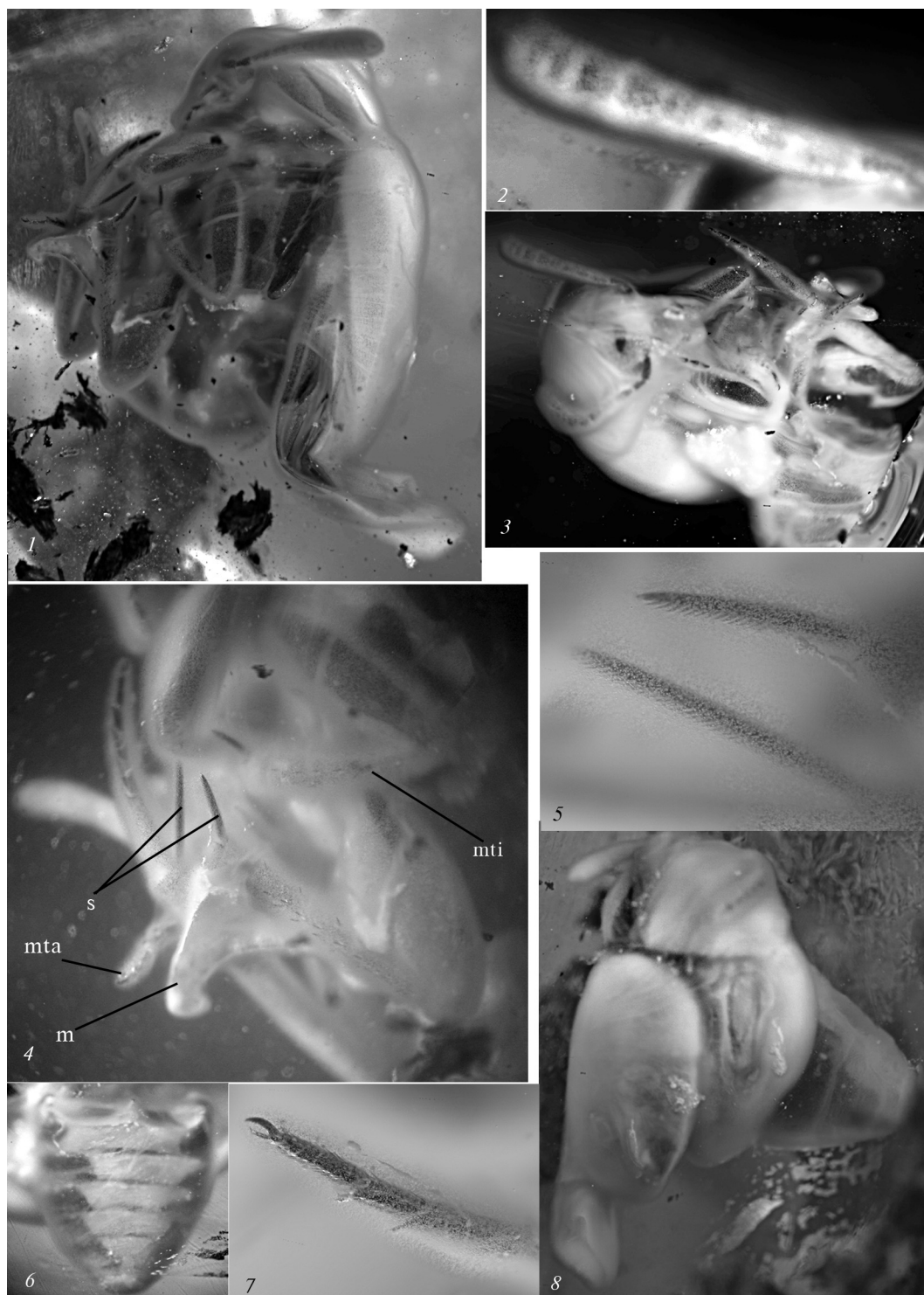
Рис. 2. Prionochaeta gratschevi sp. n., голотип (инв. номер К-2993 коллекции Института зоологии НАН Украины, Киев): 1 — общий вид сбоку; 2 — антенна; 3 — общий вид снизу; 4 — ноги и метэндостернит: s — шпоры задних голеней, mta — средняя лапка, mti — средняя голень, m — метэндостернит; 5 — шпоры задних голеней; 6 — брюшко; 7 — задняя лапка; 8 — общий вид сверху.