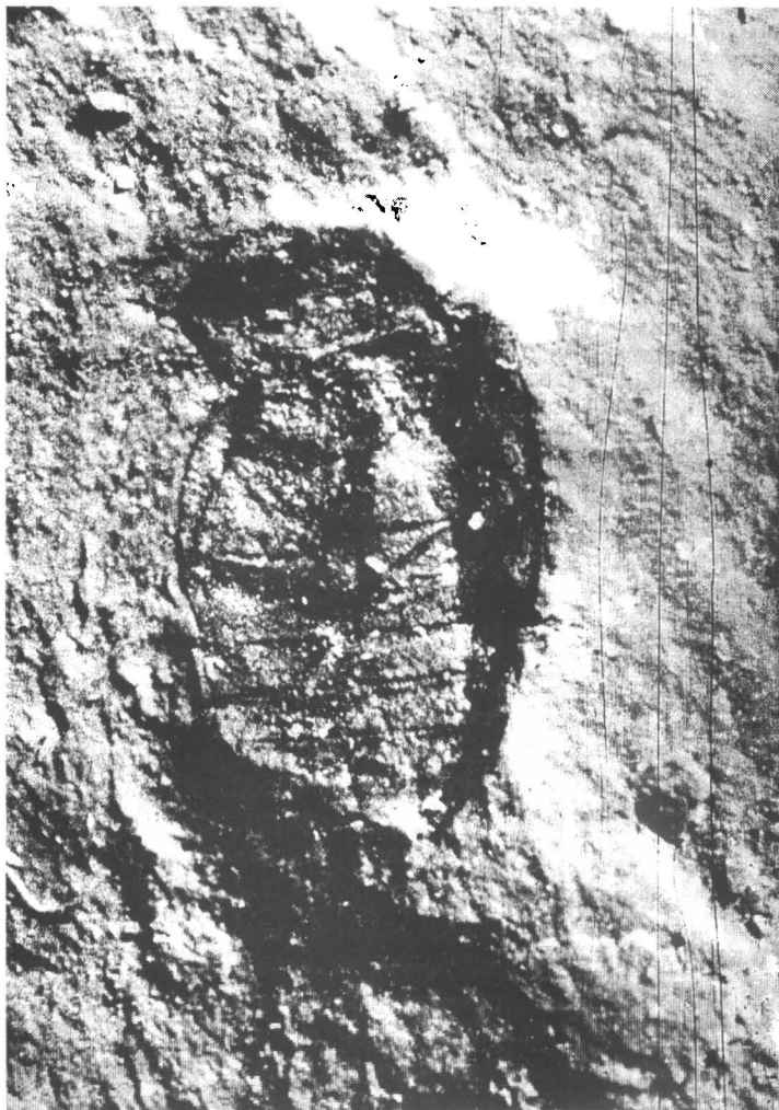
Рис. 1. Голотип Mesagyrtoides fulvus (ПИН, № 4270/1033; Монголия, Шар-Тэг, юра).

Голова длинная, в 1,5 раза уже пронотума. Глаза слабо выступают из контура головы. Голова медиальнее глаз с глубокими усиковыми бороздками, достигающими до заднего края головы. Мандибулы мощные, широкие; их наружный