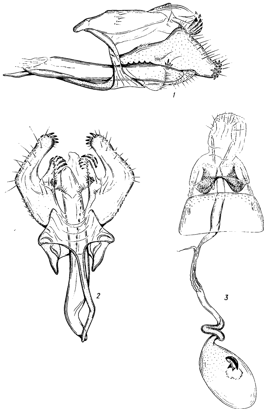
Рис. 2. Строение гениталий Microcolona aurantiella sp. n.: 1 — ♂, вид сбоку; 2 — ♂, вид снизу; 3 — ♀.

крепких тупых шипов. Лопasti юксты короткие и широкие, подушкообразные, густо покрытые на вершине щетинками; в основании они широко слиты как друг с другом, так и с вальвами. Эдеагус длинный, почти прямой, лишен корнутусов; он имеет асимметрично изогнутый базальный отросток и продольный гребень из 6 склеротизованных зуб-