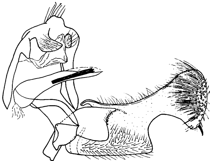
Рис. 5. Гениталии самца Pelochrista kuznetzovi Kostjuk sp. n., паратип, препарат № 1041 (Даурия).

Гениталии самки (рис. 4). Анальные сосочки удлинненно-ступенчатые с приостренными дистальными и суженными проксимальными концами. Обе пары апофиз одинаковой длины. Копулятивное отверстие (остиум) почти правильной округлой формы; дистальная часть полового протока (колликкулум) в виде прямой, хорошо склеротизованной трубки,