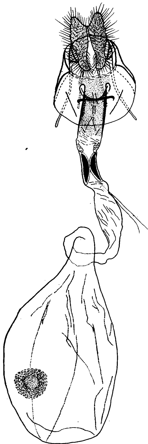
Рис. 4. Гениталии самки Selenodes helvomiculana Костюк sp. n., паратип, препарат № 1314 (Алтай, Курайский хребет).

пятну. Внешнекрайнее пятно в виде равномерной ширины ленты основной окраски вклинивается дорсальной частью между белым торнальным пятном и внешним краем. От предвершинного, четко разделенного белого костального штриха тянется короткая сизо-серая полоска, упирающаяся во внешний край крыла перед его серединой. Бахромка темно-серая, глянцевая, без разделительной линии; в области торнального пятна она сменяется длинными белыми чешуями со светло-серыми основаниями; два пучка таких же белых чешуек с интервалом между ними расположены под вершиной крыла. Задние крылья удлиненоовальные, буровато-серые; бахромка беловатая с широкой темно-серой разделительной линией. Брюшко в темно-серых блестящих чешуях. Волосная кисть на задней голени черная, вершиной достигает основания срединной пары шпор.