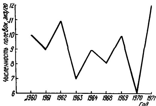
Рис. 2. Численность Прометеевых полевоек в границах ареала.

Дальнейшие наблюдения за этими полевочками в Грузии позволят расширить наши знания об их экологических особенностях и возможной роли в эпизоотологии чумы. Следует учесть, что в ряде мест на одних и тех же территориях имеются поселения Прометеевых и обыкновенных полевоек. Как известно, в условиях Закавказья обыкновенная полевочка является переносчиком чумы.