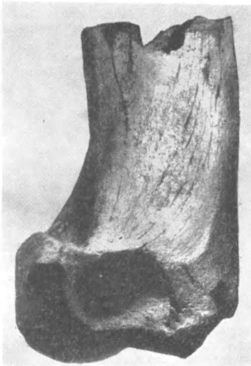
Рис. 3. Фрагмент дистального отдела плечевой кости Gigantocamelus sp. из окрестностей с. Болдинки, Одесской обл.