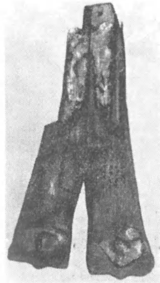
Рис. 4. Дистальный отдел плюсневой кости Gigantocamelus sp. из с. Яблонь, Одесской обл.