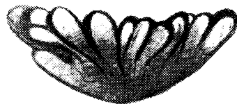
Рис. 3. 13 коконов наездника Eupteromalus micropterus Lind. в одном пупарии гессенской мухи (фото автора, \times 20 ).

В одном пупарии гессенской мухи мы обнаруживали от 1 до 13 наездников Eupteromalus micropterus Lind., причем их коконы отходили от одного отверстия пупария хозяина (рис. 3). При